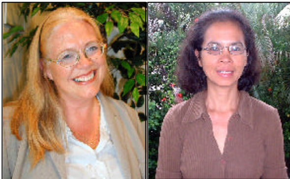
Comitê de VSs nas Filipinas e Indonésia

O trabalho nos países vizinhos com uma situação mais delicada na Indochina continua crescendo milagrosamente. Eles têm sido abençoados com pessoal extra, e tem mais gente à caminho. Os Lit-Pics nesses países continuam a produzir a Palavra fielmente no idioma