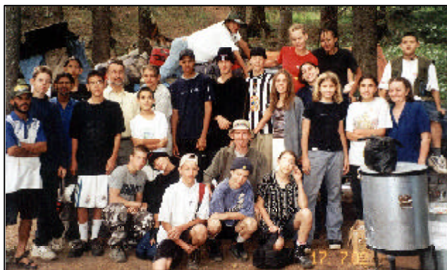
Adolescentes posam para uma foto no Paquistão antes de fazer trekking

O maior enfoque dos comitês nacionais no