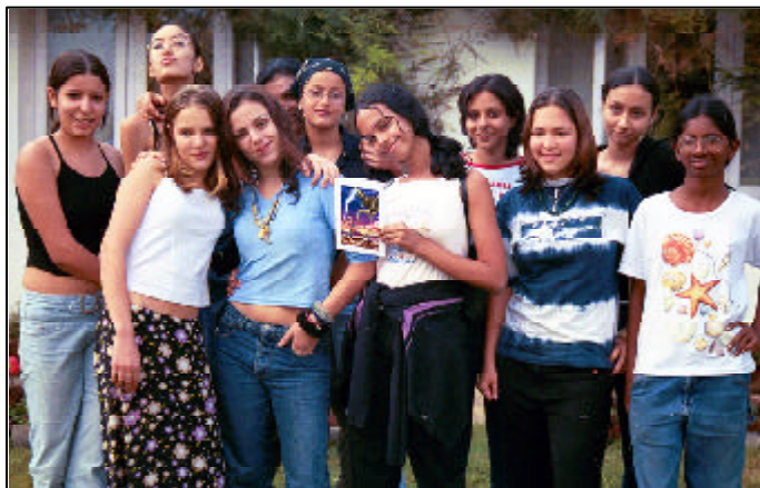
JETTs e adolescentes no sul da Índia

semanal? Estamos todos esperando no carro!