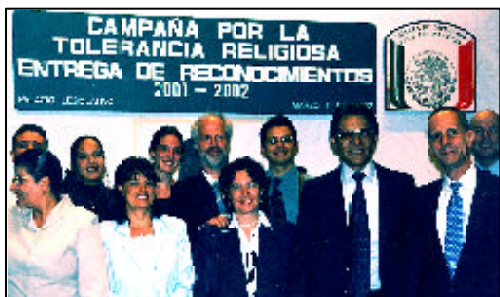
Membros do comitê de PR no México durante um evento no congresso

incrível porta aberta para conhecermos os chefes de várias organizações e autoridades do governo de um modo que nunca antes conseguimos. Tem nos ajudado ficar a par da linha de pensamento dos acadêmicos e políticos em relação às religiões e à tolerância. Também tem nos dado uma plataforma para expormos a Família, nosso trabalho e mensagem através de nossa música e escritos, que extraímos de nossas publicações sobre determinados assuntos como tolerância, o papel da mulher na sociedade, etc.