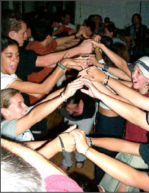
América central: Nenhum acampamento seria completo sem uma dança cigana.