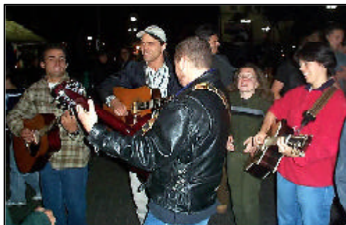
Testificando na rua na cidade do México

Sair para testemunhar pessoalmente e fazer exemplos do Espírito Santo a cada duas semanas num popular ponto de encontro da cidade é uma das atividades de maior destaque na nossa área. Tornou-se um dos maiores destaques para todos os jovens na área, que deslanchou o fogo da testificação de volta ao básico em todos nós!