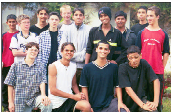
JETTs e adolescentes no sul da Índia

Aparecida (abreviação para desconhecida): Ei, pessoal! Vocês vão vir para o jogo de futebol