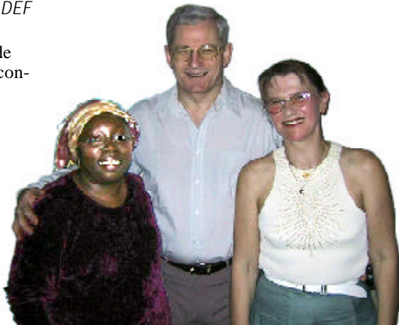
Europa Ocidental: comitê do DEF do norte

Trabalhamos para montar bibliotecas de recursos em nível nacional. Meekness (no norte) conseguiu alguns bons des-