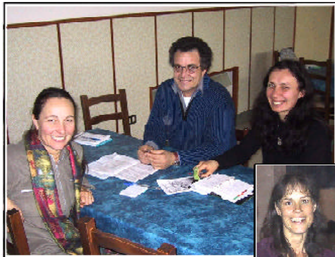
Europa Ocidental: comitê do DEF do sul