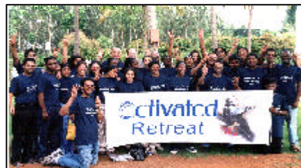
Retiro da Contato em Bangalore

O DIT sul produziu para os Lares vários materiais que alimentam e num formato de fácil utilização: As 12 Pedras do Alicerce em livrinhos do tamanho das BNs; Vinho Novo e Wine Press encadernados com espirais numa série de quatro livros; revistas Contato de 1 a 15 encadernadas com espiral e junto uma folha de aulas (agora disponíveis para os Lares no mundo todo atra-