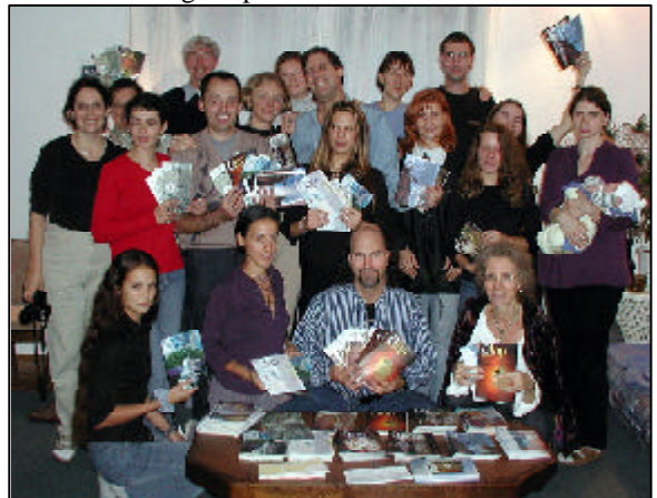
Reunião da Contato em setembro de 2002 em Budapeste