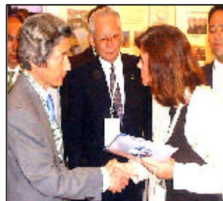
Rachel com o primeiro-ministro japonês Junichiro Koizumi durante a Cúpula Mundial em Joanesburgo