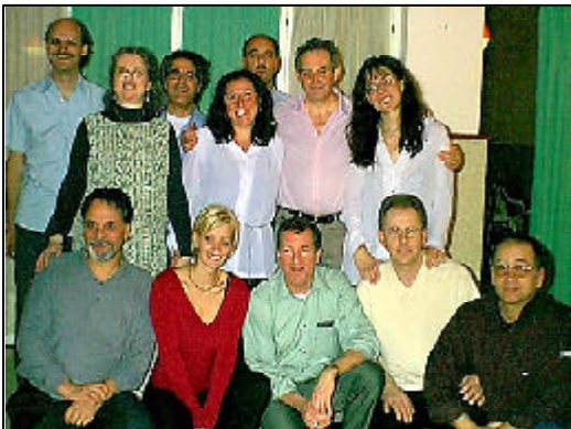
Membros do comitê de DIT na Europa Ocidental

dia e que “não havia mais mundos para conquistar”. Agora vemos uma nova geração a ser alcançada como também uma batalha sendo preparada pelos corações e almas dos homens no que será o trono do poder do Anticristo e seu governo mundial. Quando percebemos isto, sentimos: “Puxa! Estamos no centro de ação!”