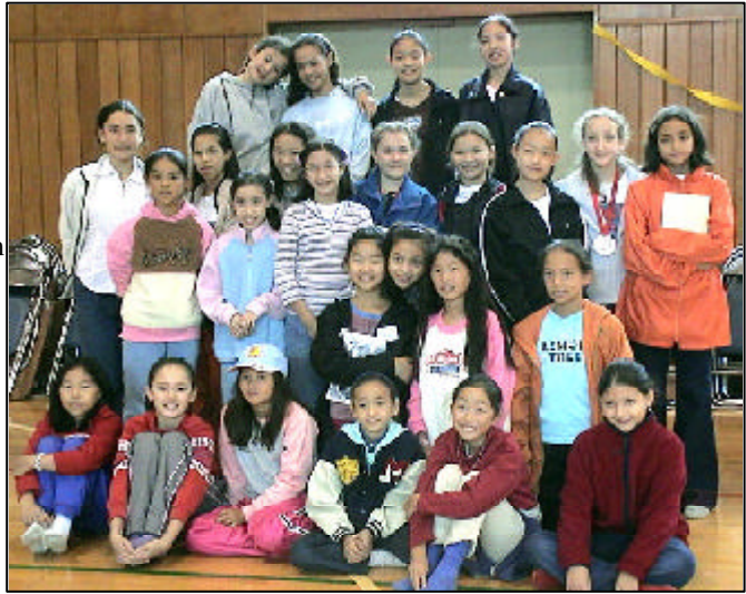
As meninas no Leste do Japão durante o acampamento para OC's no Outono de 2002