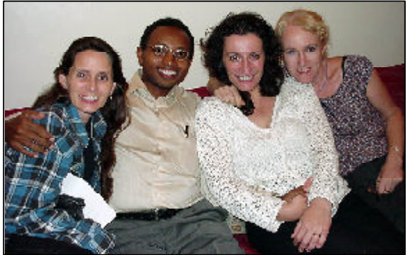
Em cima: Comitê nacional da África Ocidental No meio: Comitê nacional do sul da África Em baixo: Comitê nacional do Oeste da África

Duas cartas de notícias foram enviadas sobre assuntos como o padrão de educação da Carta Magna, idéias para fazer pastas com os trabalhos escolares das crianças, dicas sobre o CVC, bibliotecas da Palavra, lista de itens que se pode receber por e-mail, promoção do site só para membros para os pais e professores, e idéias e pontos abordados na Palavra recentemente sobre educação escolar.