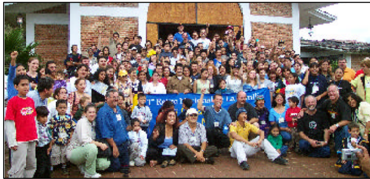
Encontro nacional no México

Também assumimos o compromisso de nos comunicarmos bastante com o Service Center e com o escritório Contato, para passarmos para eles sugestões e idéias do campo para criarmos e/ou produzirmos certas coisas. As reuniões do comitê de DIT também suprem um ótimo input para o estúdio local na lingual espanhola, para nos ajudar a ver melhor que tipo de material novo precisamos produzir.